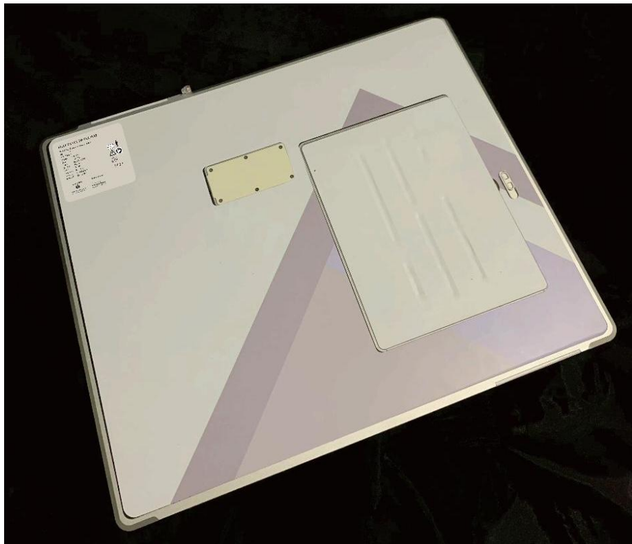
Tampak Belakang IMEDEV FPD