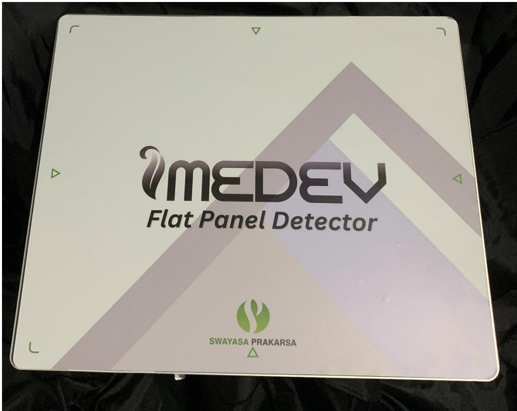
Tampak Depan IMEDEV FPD