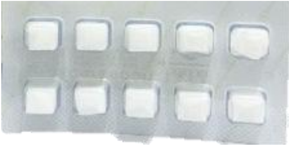
CERASPON Hemostatic Sponge tipe kubus ukuran 1x1x1cm