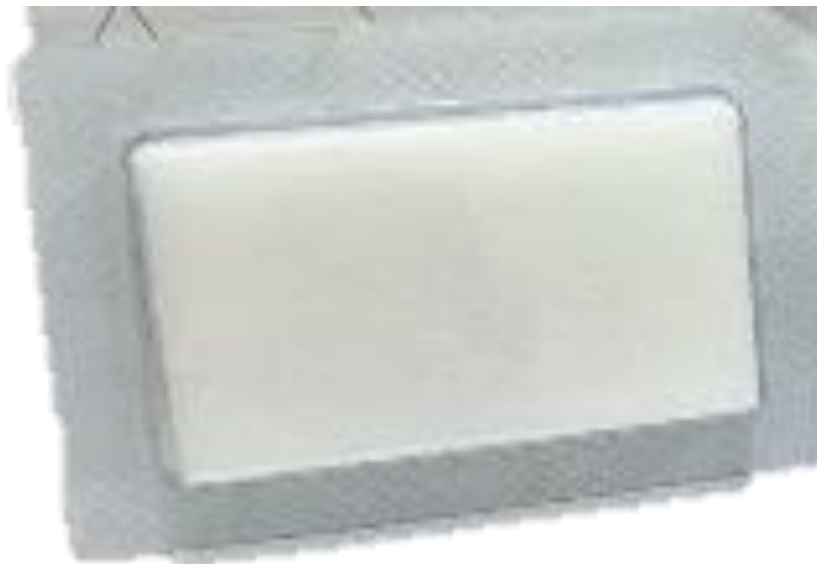
CERASPON Hemostatic Sponge tipe kubus ukuran 6x4x1 cm