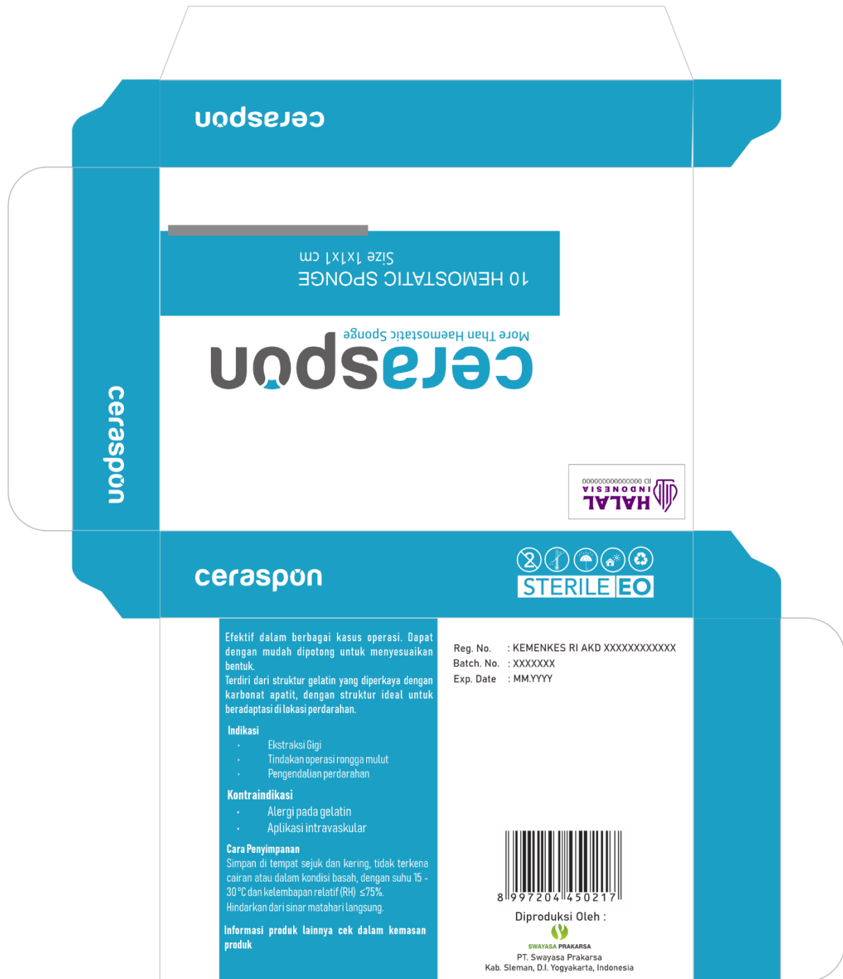
Kemasan CERASPON Hemostatic Sponge tipe kubus ukuran 1x1x1 cm